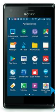
Paso 4 Revisar que haya quedado en tus aplicaciones