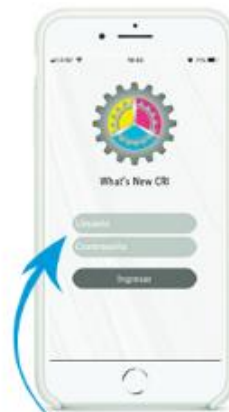
Paso 5 Ingresar con su "Usuario y Contraseña" (el mismo que utiliza para ingresar al pizarrón, pagos y boletas)

Para más información, favor de comunicarse a: "SOPORTE TÉCNICO" TEL. 55 6717 0017