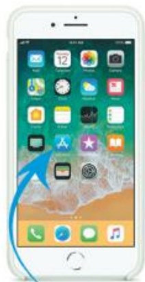
Paso 1 Ingresar a "App Store"