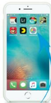
Paso 4 Revisar que haya quedado en tus aplicaciones