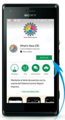
Paso 3 Dar click donde indique la flecha