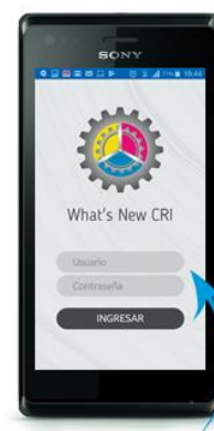
Paso 5 Ingresar con su "Usuario y Contraseña" (el mismo que utiliza para ingresar al pizarrón, pagos y boletas)

Para más información, favor de comunicarse a: "SOPORTE TÉCNICO" TEL. 55 6717 0017