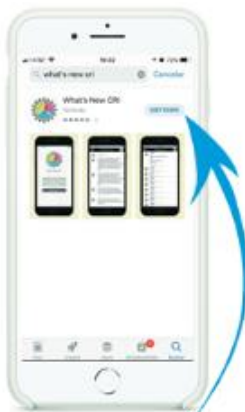
Paso 3 Dar click donde indique la flecha