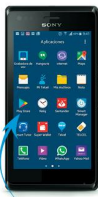
Paso 1 Ingresar a "Play Store"