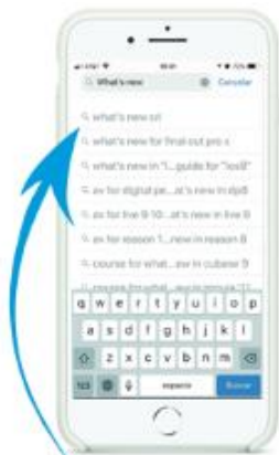
Paso 2 Buscar la aplicación "What's New Cri"